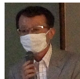
活動報告 武蔵野の森を 育てる会の代表