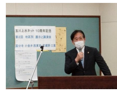
来賓挨拶 三鷹市長 河村孝氏