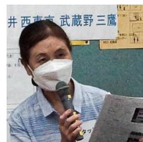
活動報告 玉川上水を守り育てる 武蔵野市民の会の代表