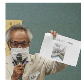
活動報告 井の頭の歴史を 知る会の代表