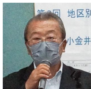
活動報告 美しい水の会の代表