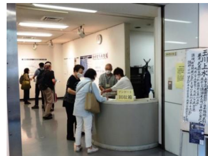
展示会会場入り口